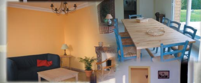
Salon et salle de séjour