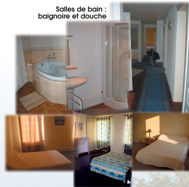
Chambres de lits doubles